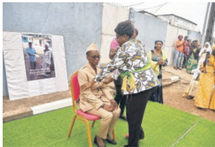
Phase de l'installation officielle par la maire du 3e arrondissement.