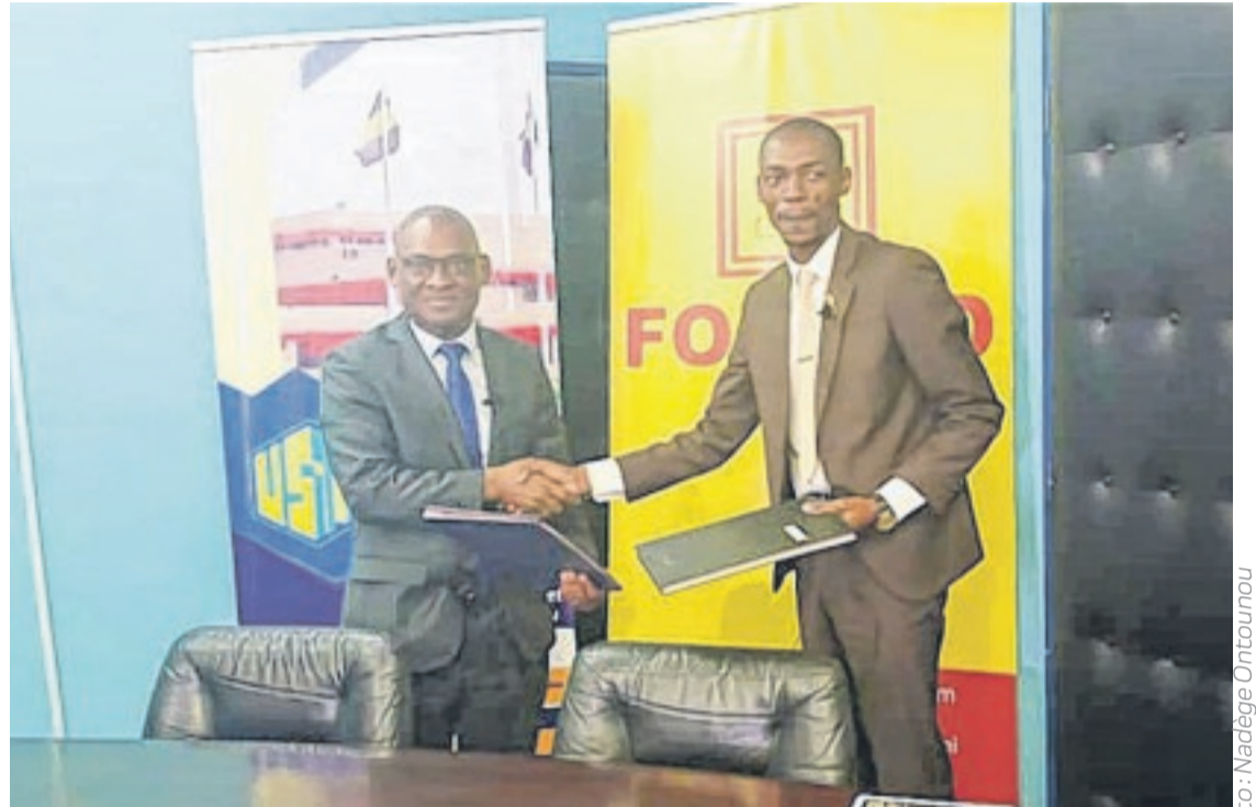
Échange de documents après la signature de la convention USTM-Foberd Gabon.

Le partenariat s'inscrit dans la mise en œuvre des programmes d'accompagnement à l'emploi et à la formation.